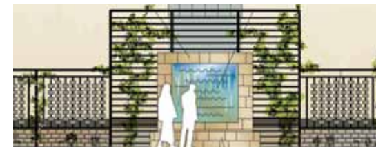
Askgravlunden vid kyrkans södra del