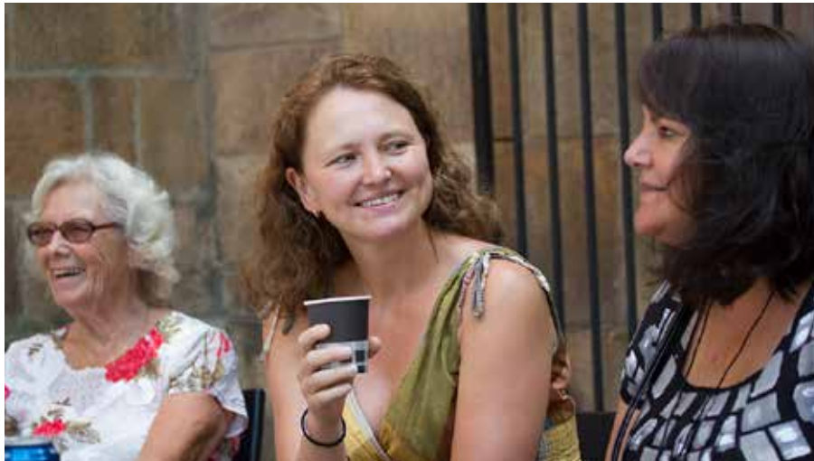
Sommarcaféet är ett mötenas café, en mötesplats för församlingsbor och alla som passerar förbi.

Tisdag och torsdag kl 13.00. Entré 20 kr vuxen, barn/ungdom under 18 år gratis. Biljett köps i caféet. Begränsat antal platser, max 15 personer, per tillfälle. OBS! Alla måste ha biljett. Uppstigning sker på egen risk. Med reservation för ändringar.