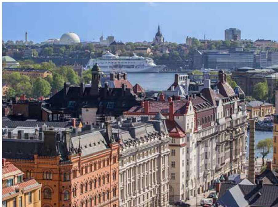
Utsikt från kyrktornet.