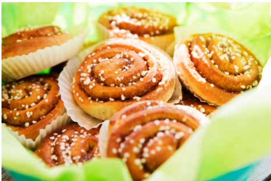
Caféet håller öppet mellan kl 11.00 och 16.00 på vardagar.