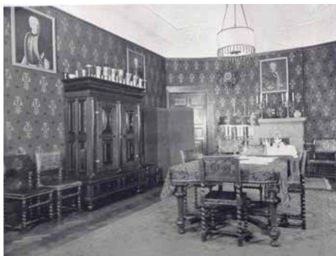
Matsalen med ekskåp från 1600-talet.