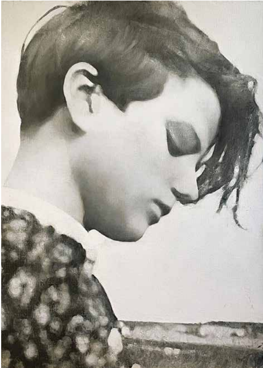
"utan titel (Sophie Scholl)" 2014