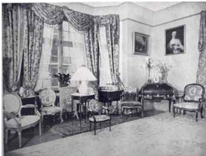
Ett hörn i Stora salongen med Dahlins sekretär.

Våningen beskrevs i Svenska Hem 1932, och därifrån är också fotona hämtade.