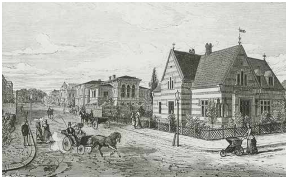
Ur tidsskriften Jorden rundt, avfotografat på Stads museet