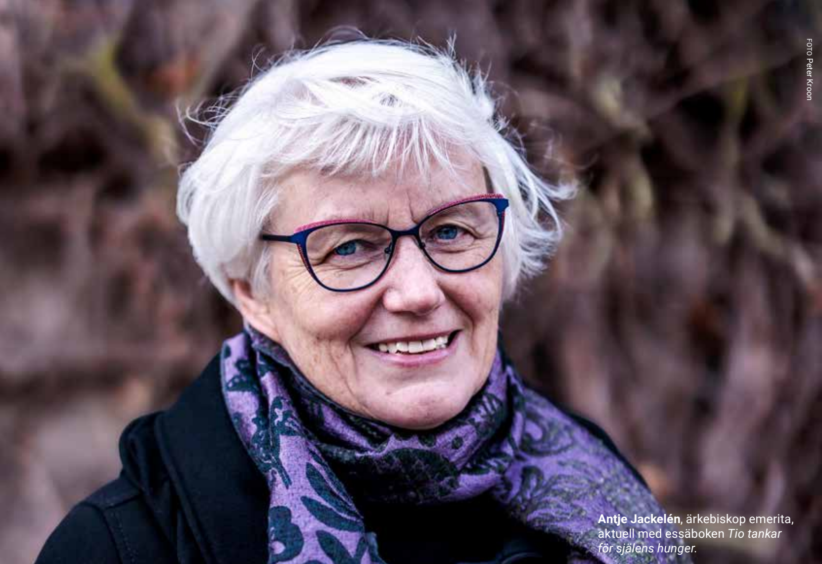
Antje Jackelén, ärkebiskop emerita, aktuell med essäboken Tio tankar för själens hunger .